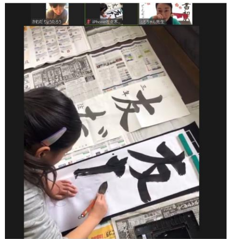
集中する子供たち