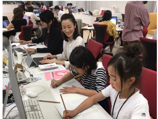
子連れ出社の様子（2019年）