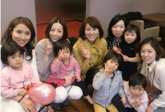
社員と子供たちの様子（2019年）