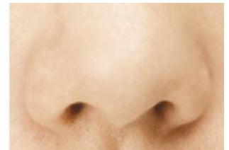
※毛穴汚れが取れたキレイな鼻