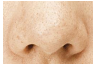
※毛穴に汚れが詰まった鼻

マナラが日本で初めて採用した、新成分【ケアナリア】。ケアナリアは毛穴悩みの原因になる「悪玉皮脂」を抑え、天然のクリームと呼ばれる「善玉皮脂」を増やし、毛穴の黒ずみひらき・角栓にアプローチします。