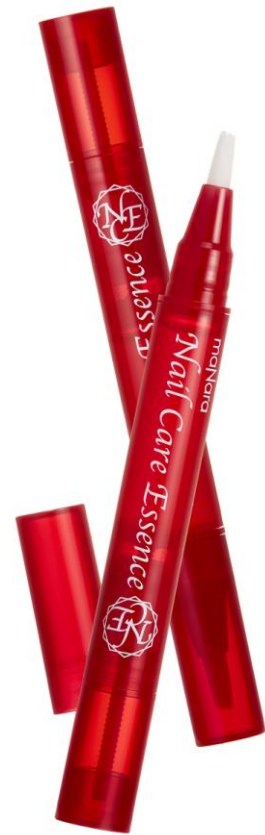
マナラ ネイルケアエッセンス 3.6mL/2,175円+税

さらにこだわったのが甘皮ケア。甘皮を放置していると固くなったり、ささくれになり、見た目の印象が悪くなります。適度な甘皮ケアをしないと健康な爪が生えてこないのです。爪だけでなく、甘皮を同時にケアできる簡単ケアにこだわりました。